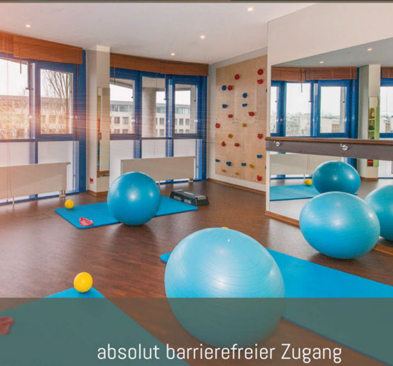
absolut barrierefreier Zugang